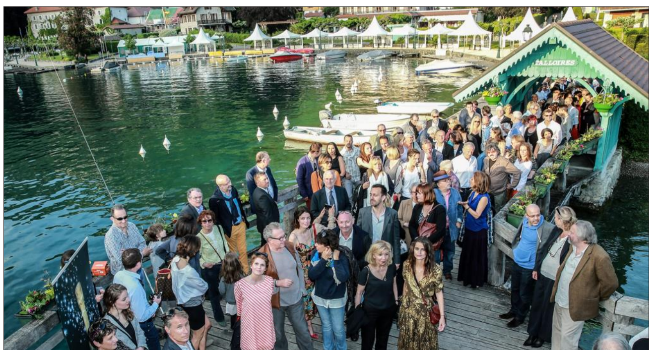
Les écrivains, quelques minutes avant d'embarquer sur “Le Cygne”, pour une croisière au cours de laquelle un stylo d'une marque prestigieuse leur a été remis.