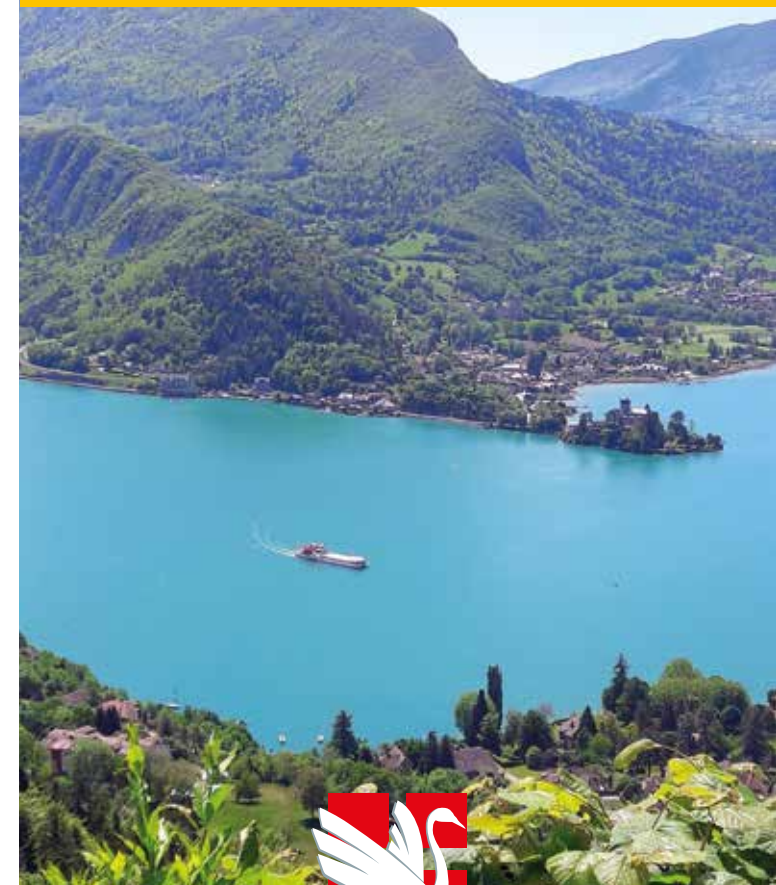
www.dsg-prod.fr - 04 27 02 15 33 - - Édition Juin 2017 - Ne pas jeter sur la voie publique